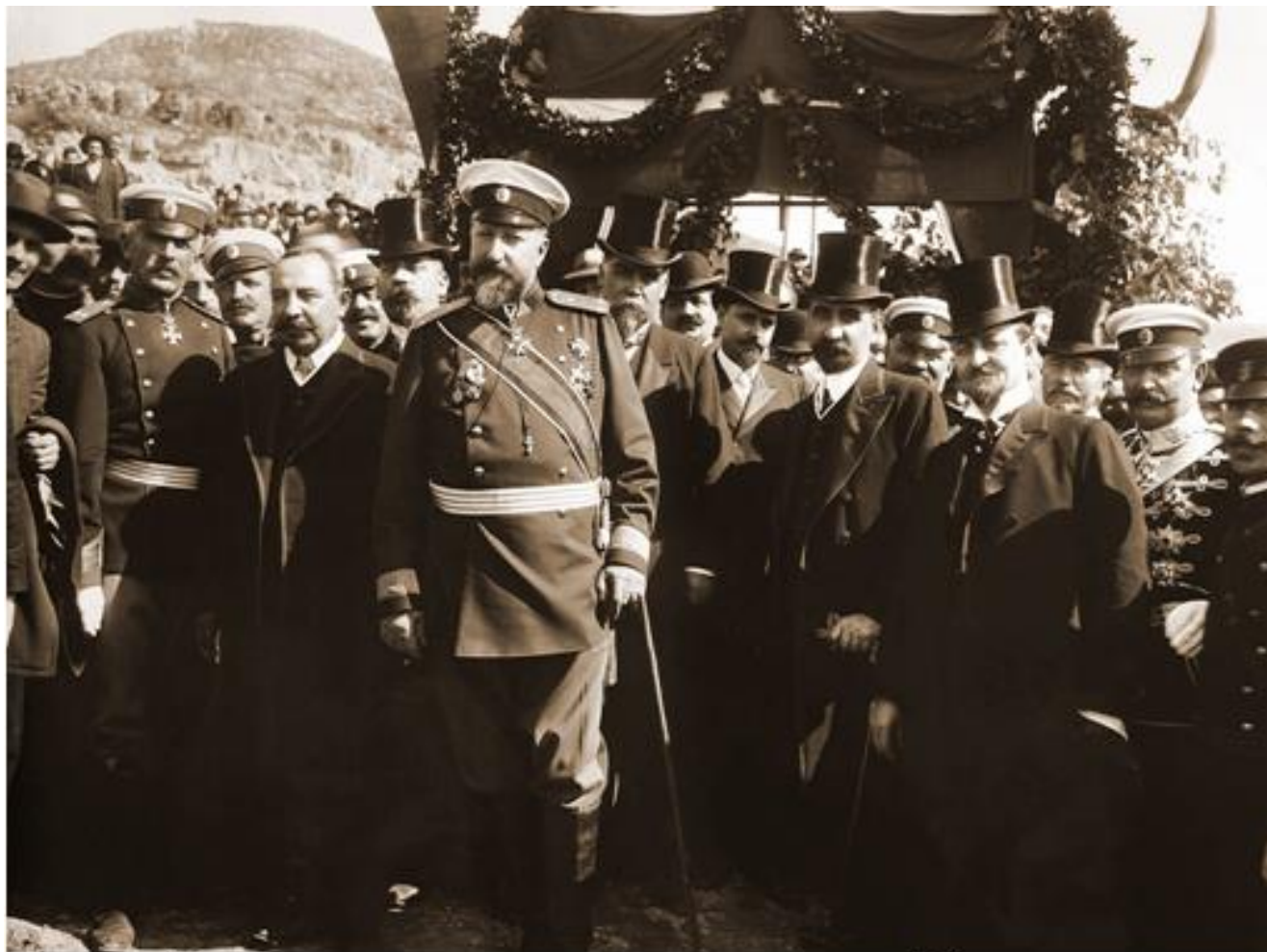
Фердинанд, правителството и генералитета край Търново по случай провъзгласяване на Независимостта 22 септември 1908г.